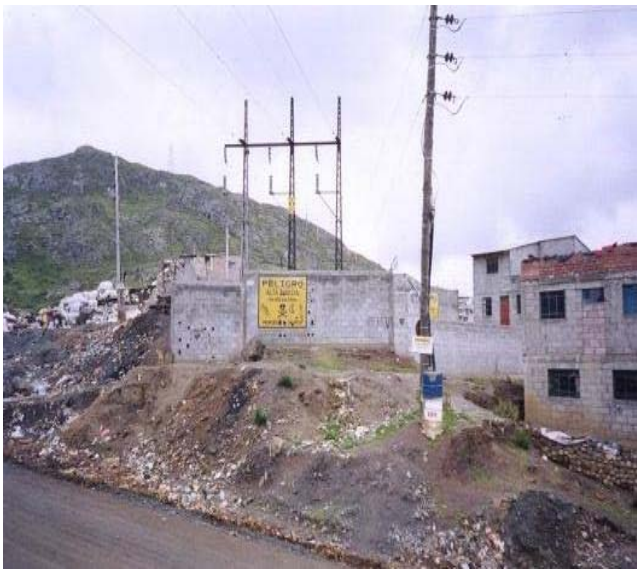
TORRE N 9