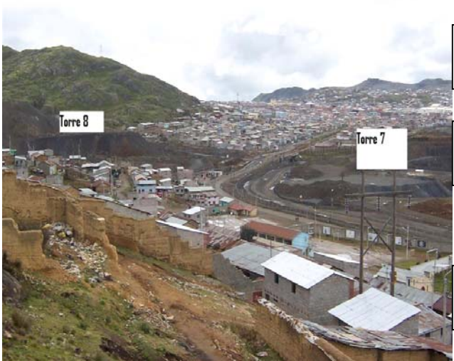
VANO 7(T07 – T08) L6523