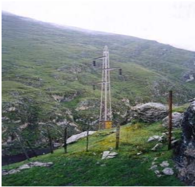
TORRE N 57