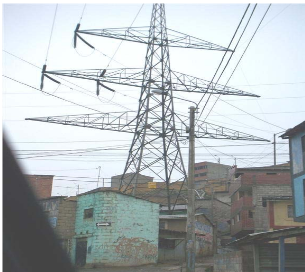
TORRE N 4