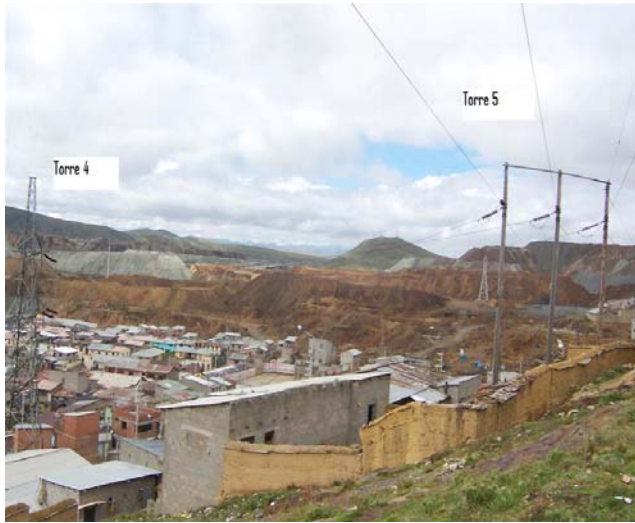
VANO 4(T04 – T05) L6523