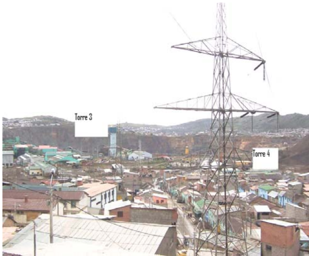
VANO 3(T03 – T04) L6523