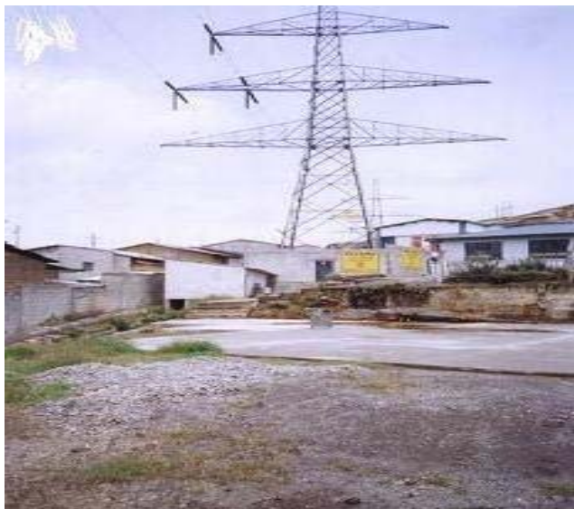
TORRE N 3