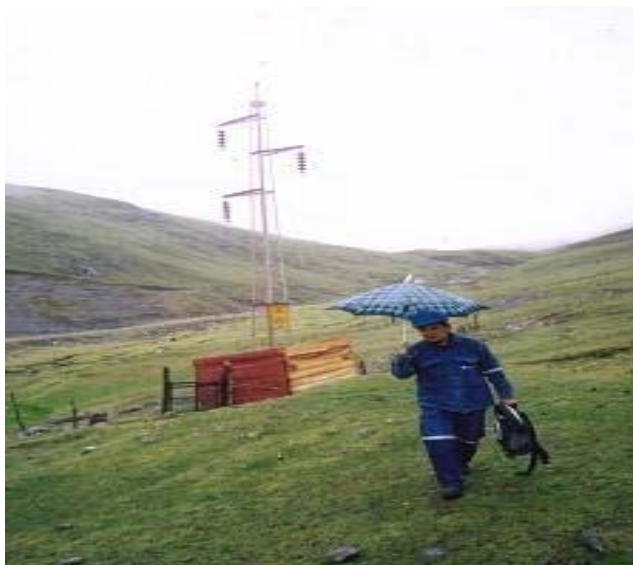
TORRE N 38