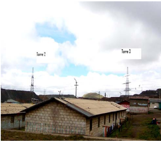
VANO 2(T02 – T03) L6523