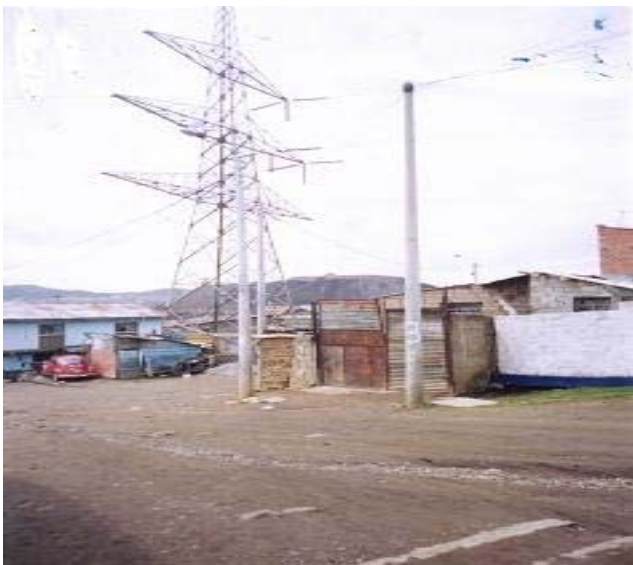
TORRE N 2