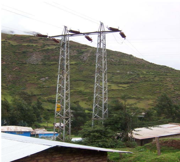
VISTA DE PERFIL