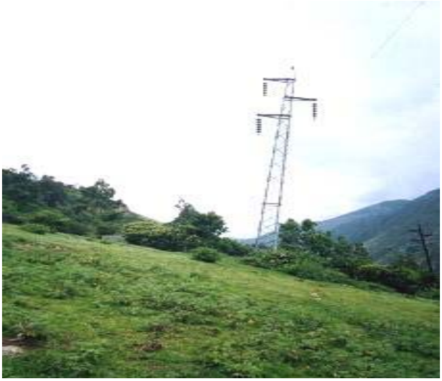
TORRE N 24