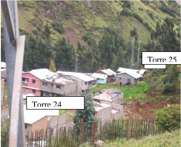
VANO (T024 – T025) L6523A