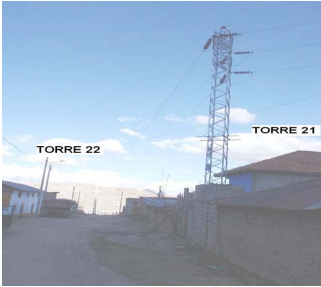
VANO 21(T021 – T022) L6523