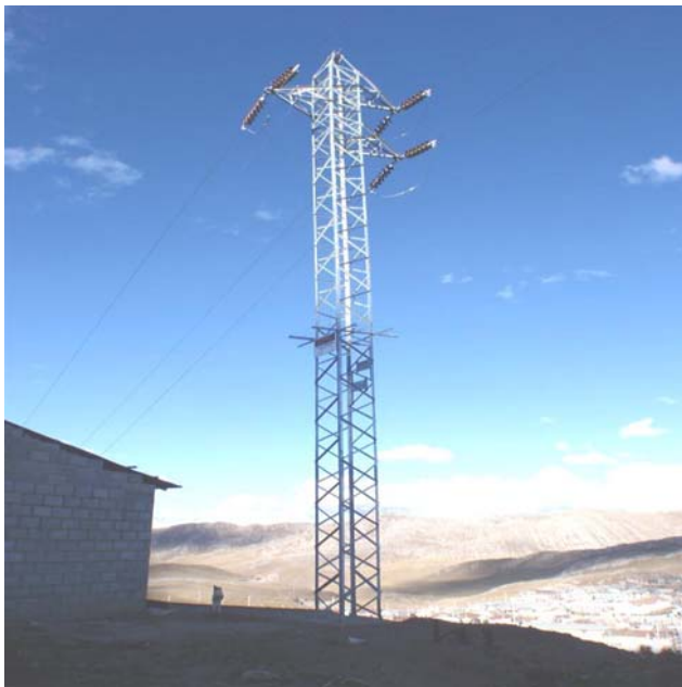
TORRE N 20