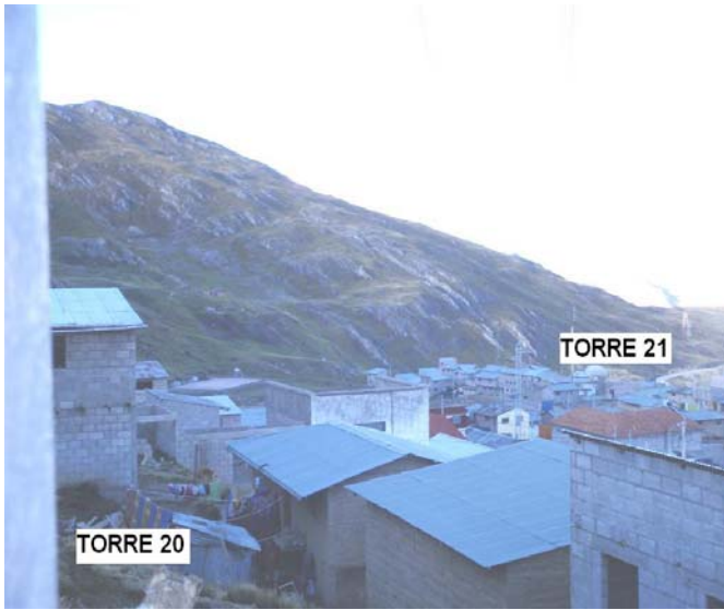
VANO 20(T020 – T021) L6523