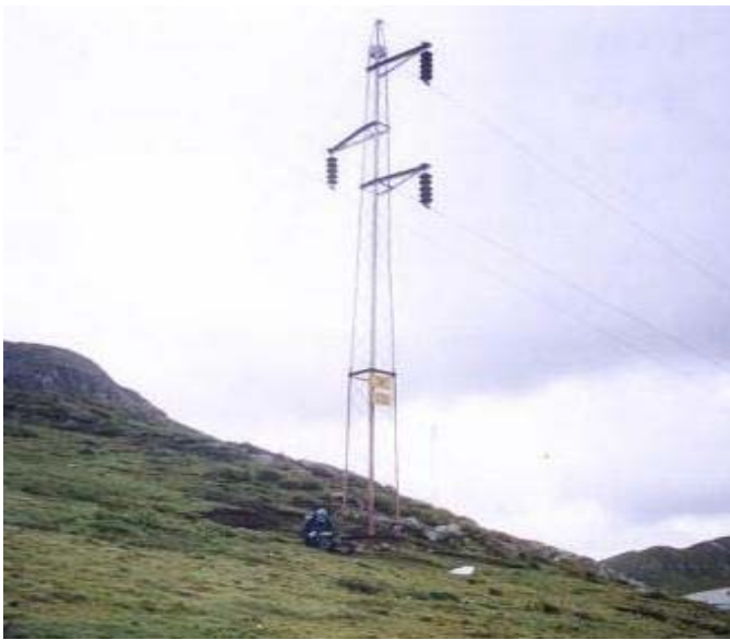
TORRE N 19