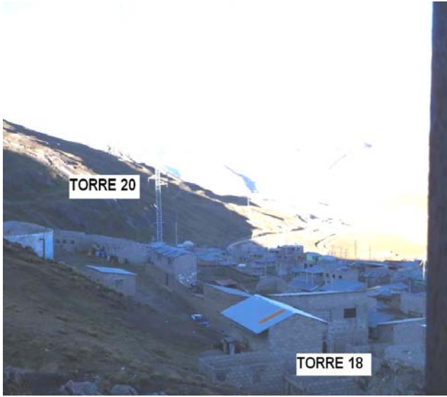
VANO 18(T018 – T020) L6523