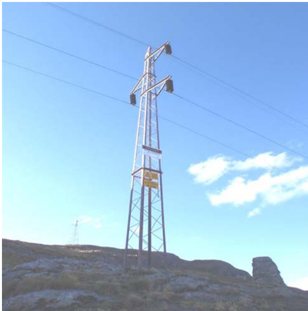
TORRE N 18