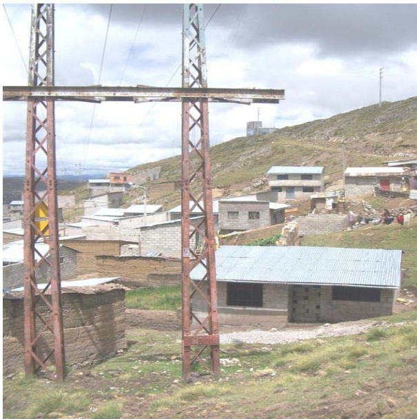
TORRE N 16