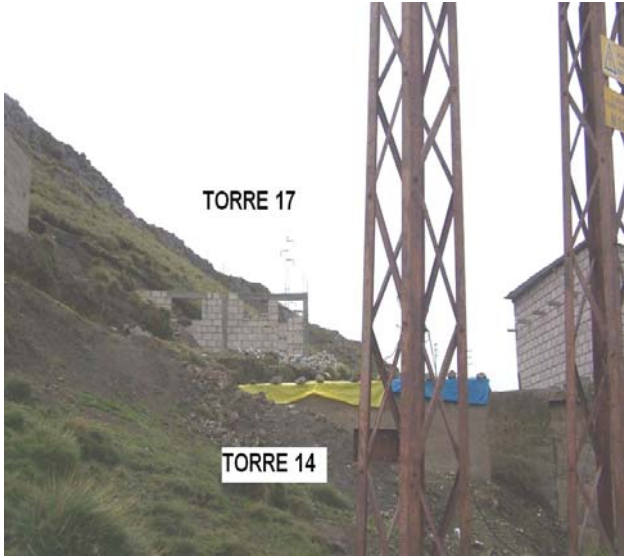
VANO 16(T016 – T017) L6523