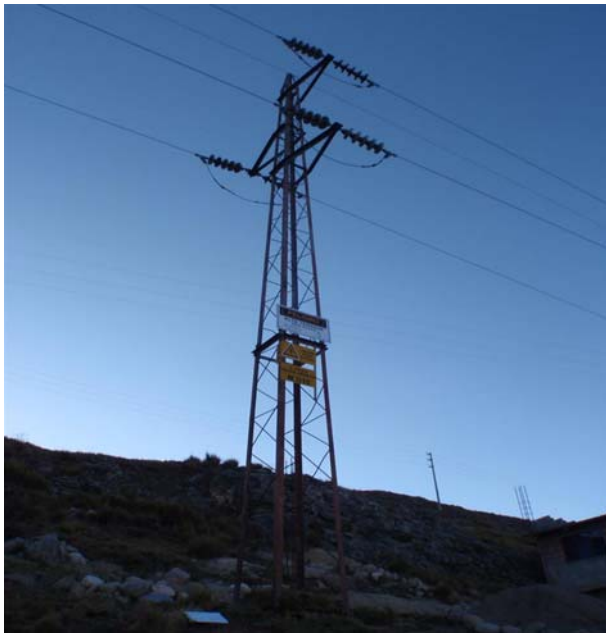
TORRE N 15