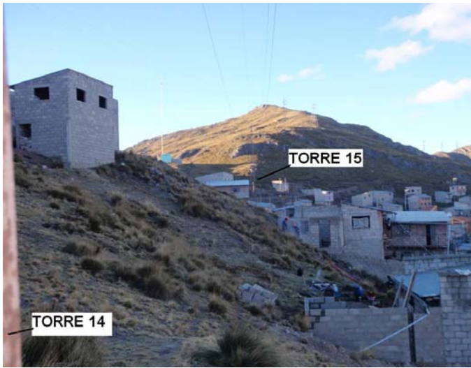
VANO 14(T014 – T015) L6523