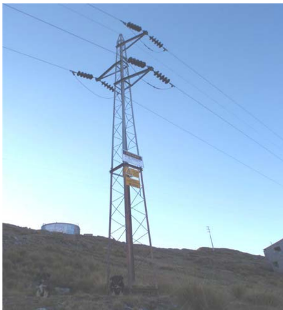
TORRE N 14