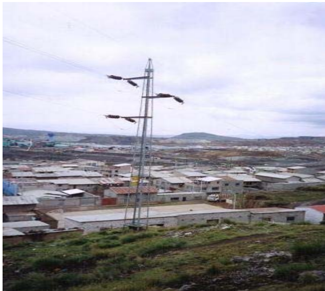
TORRE N 11