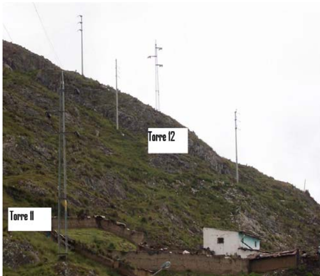
VANO 11(T011 – T012) L6523