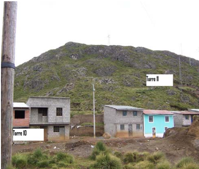
VANO 10(T010 – T011) L6523