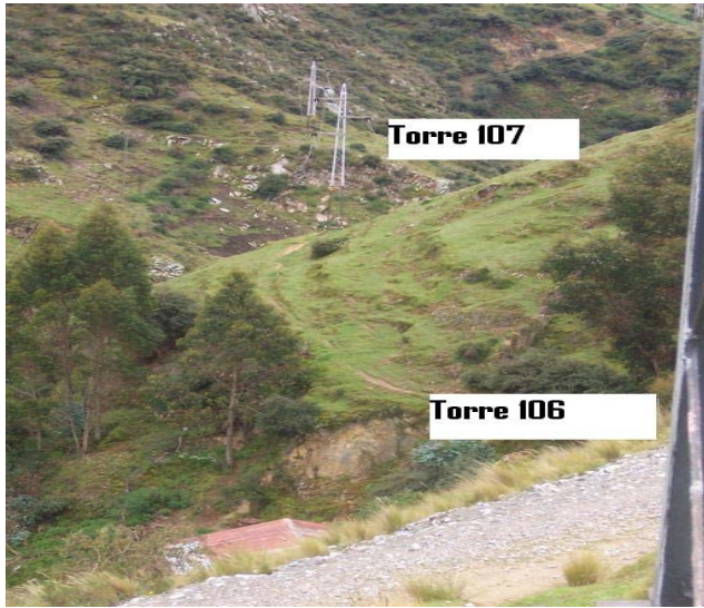
VANO 106(T0106 – T0107) L6523