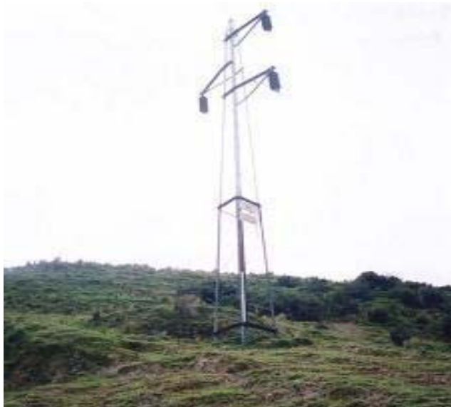
TORRE N 106