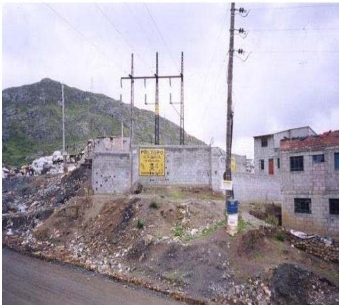
TORRE N 9