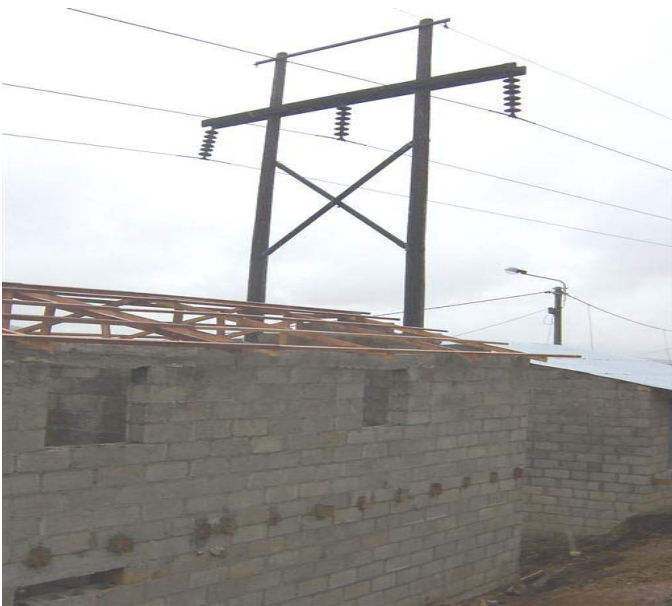
TORRE N 7