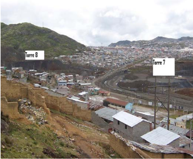
VANO 7(T07 – T08) L6523