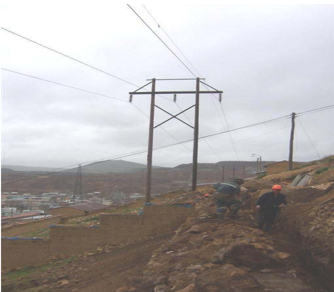
TORRE N 6