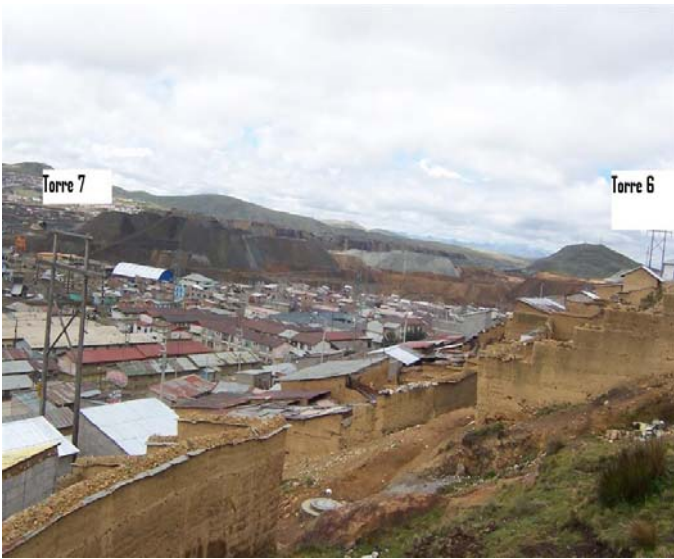
VANO 6(T06 – T07) L6523