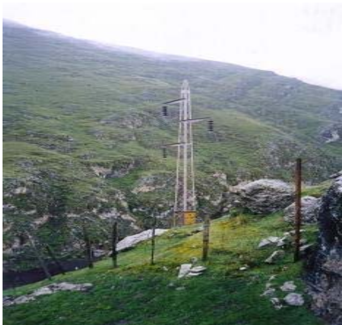
TORRE N 57