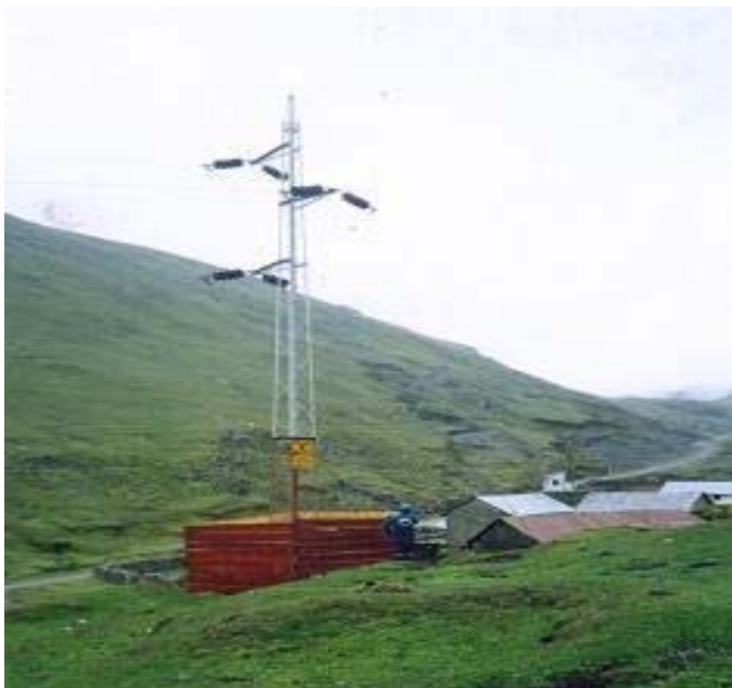
TORRE N 41