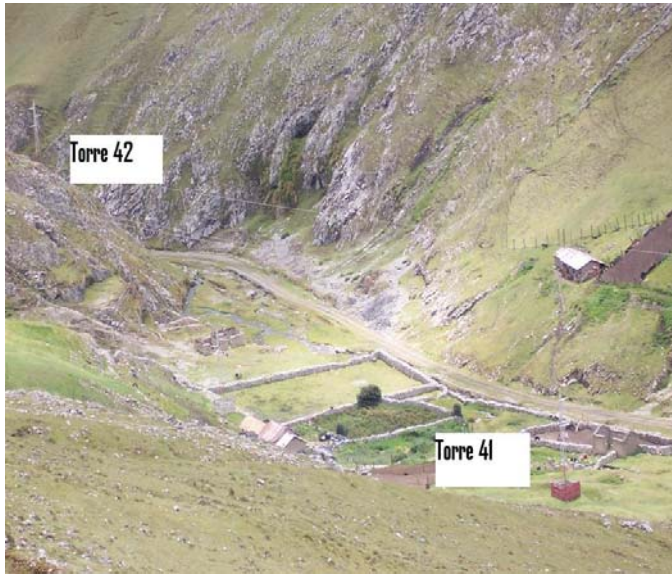
VANO 41(T041 – T042) L6523