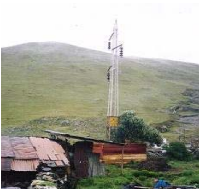
TORRE N 40