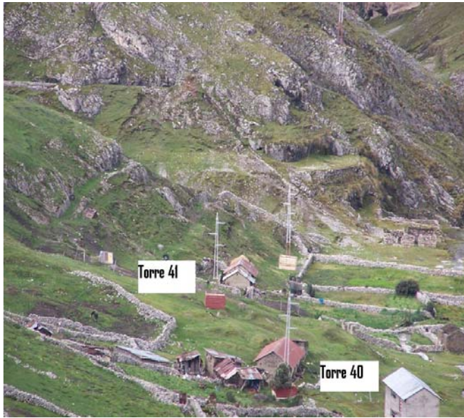
VANO 40(T040 – T041) L6523