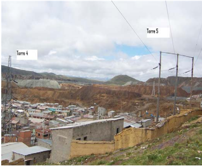
VANO 4(T04 – T05) L6523