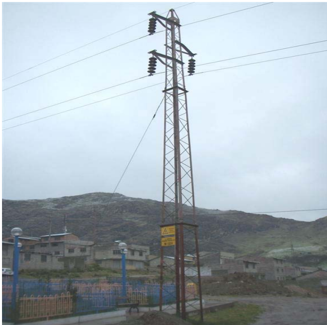
TORRE N 24