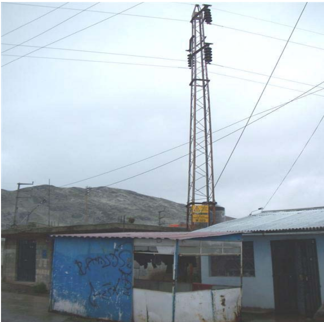
TORRE N 23