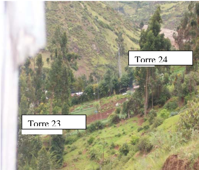
VANO (T023 – T024) L6523A