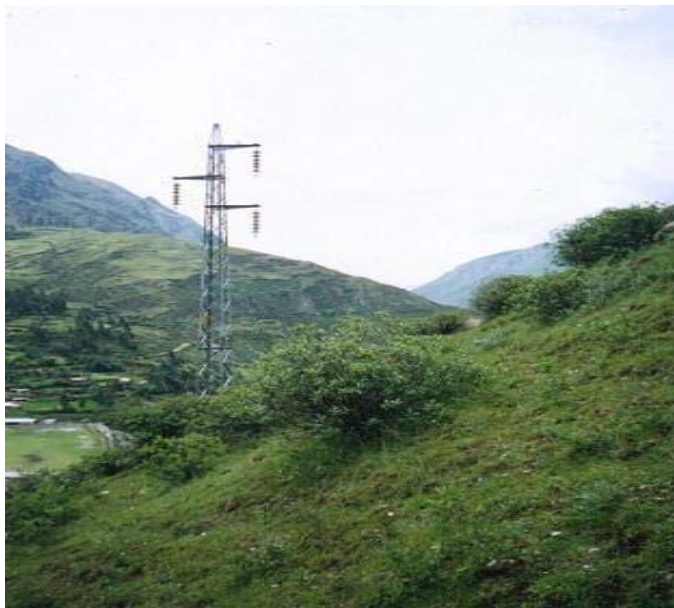
TORRE N 23