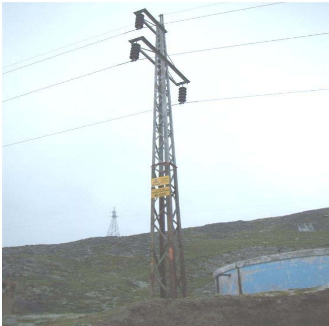
TORRE N 20