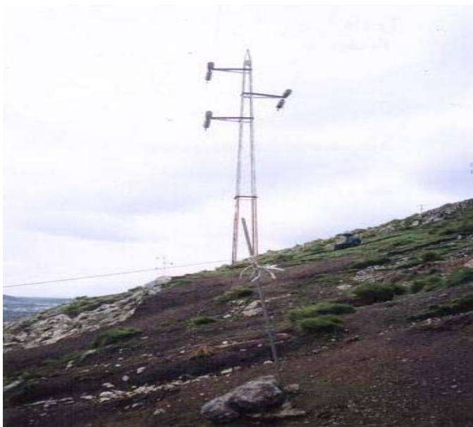
TORRE N 14