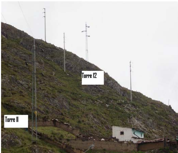
VANO 11(T011 – T012) L6523