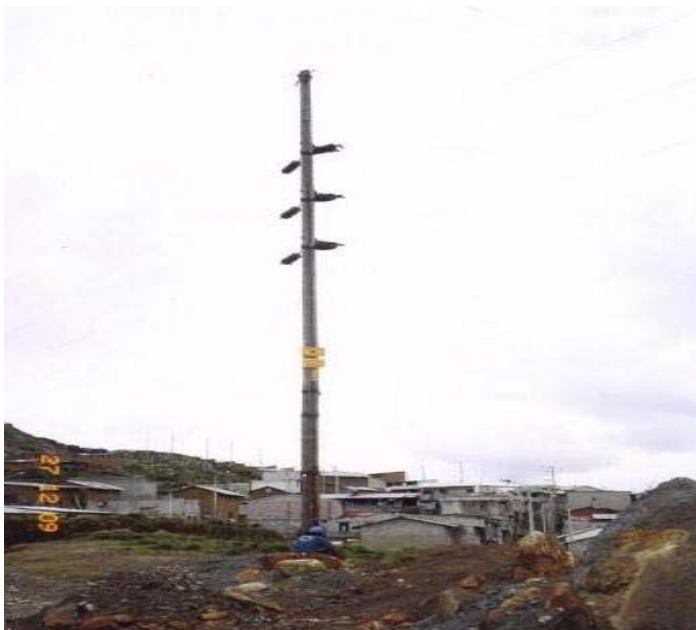
TORRE N 10