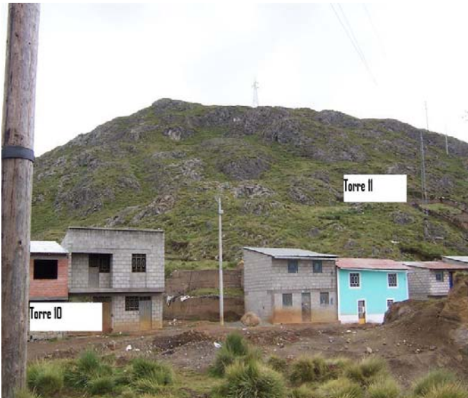
VANO 10(T010 – T011) L6523