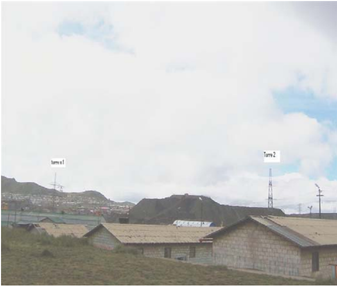
VANO 1(T01 – T02) L6523