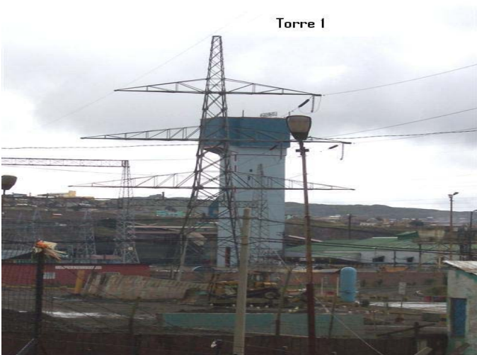
TORRE N 1