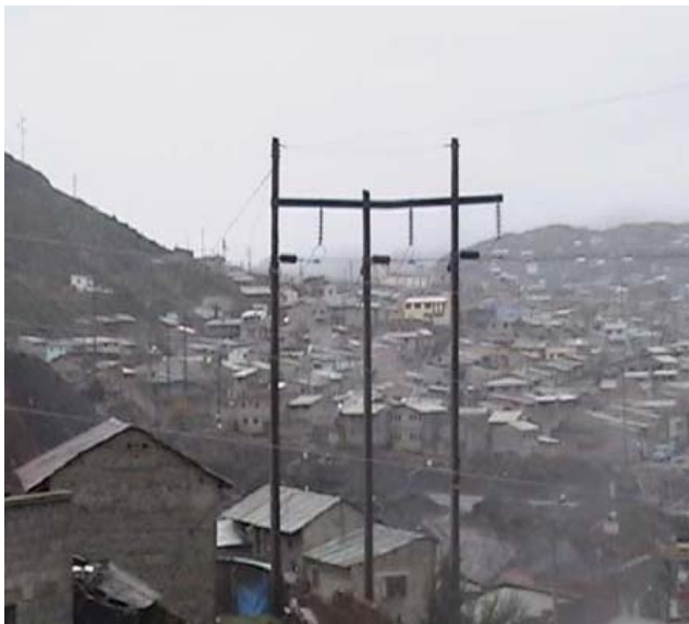
TORRE N 8