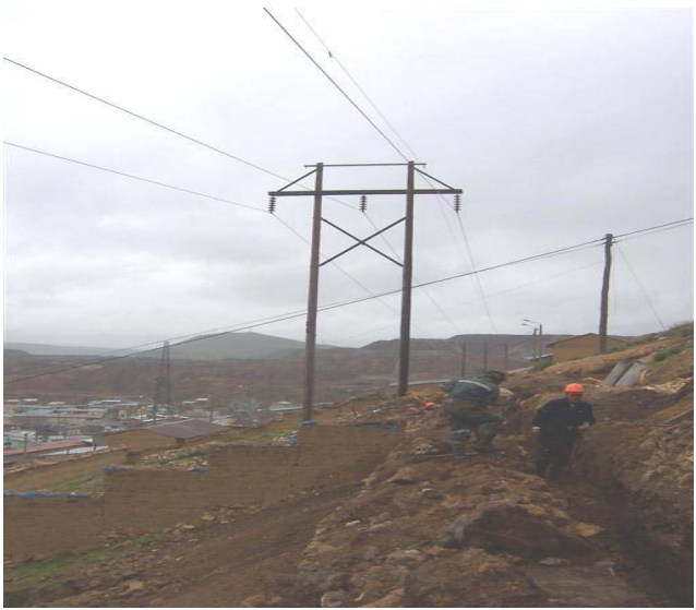
TORRE N 6