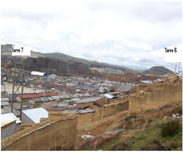
VANO 6(T06 – T07) L6523