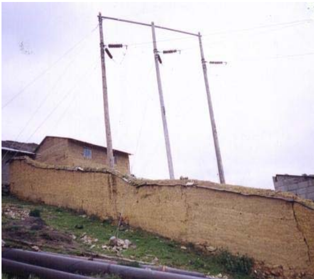
TORRE N 5