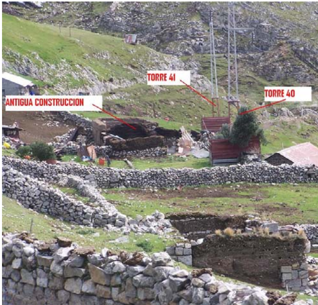
VANO 40(T040 – T041) L6523