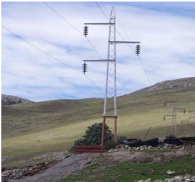
TORRE N 40