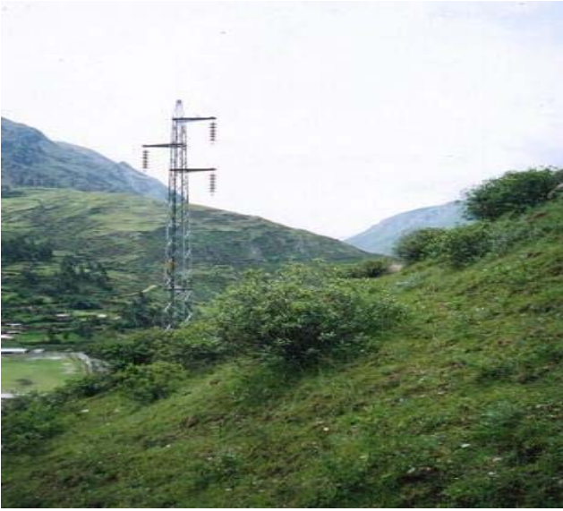
TORRE N 23