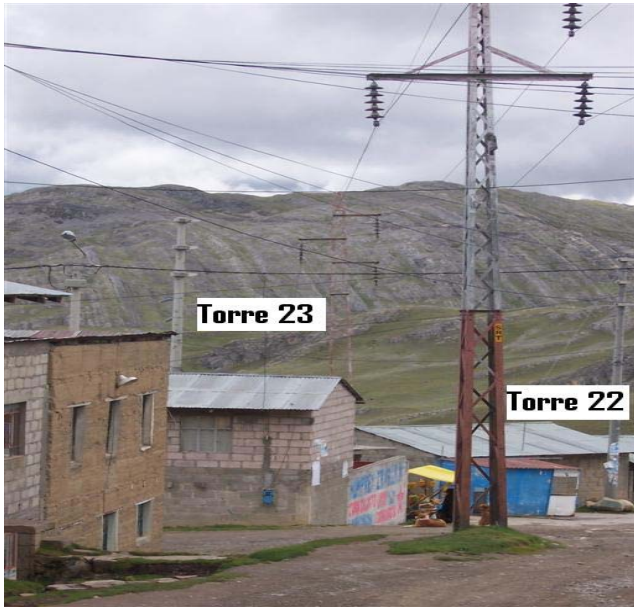
VANO 22(T022 – T023) L6523