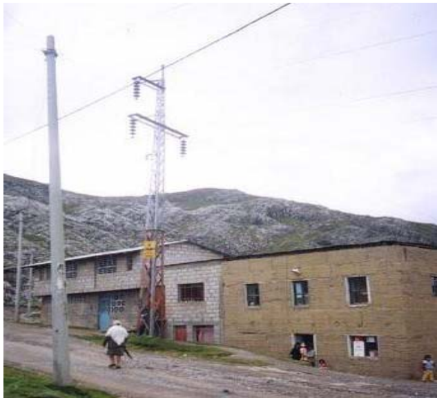
TORRE N T022