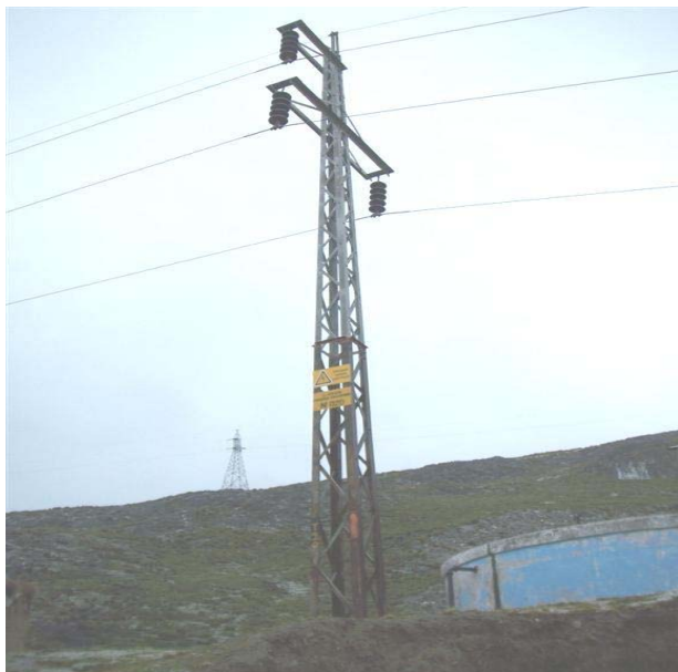
TORRE N 20