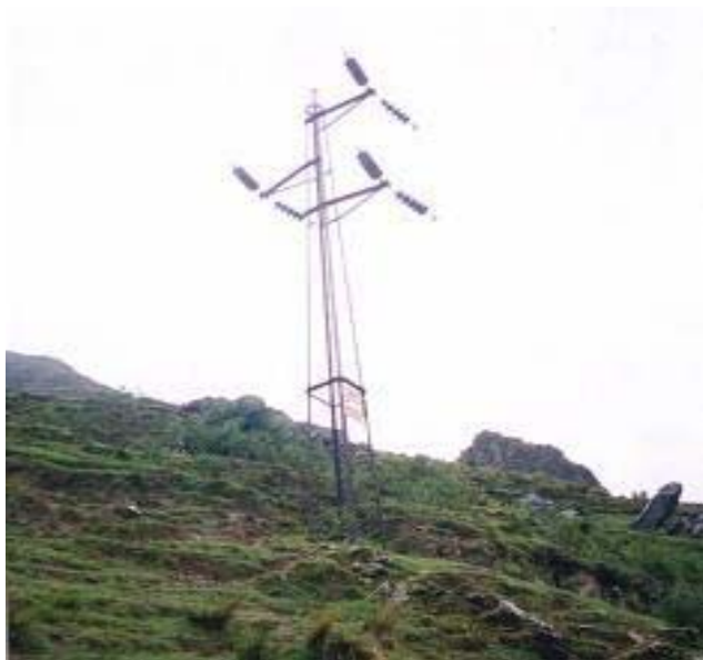
TORRE N 103