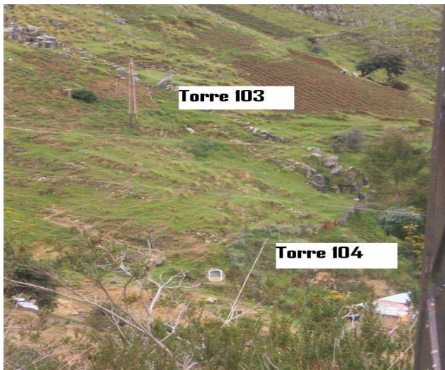
VANO 103(T0103 – T0104) L6523